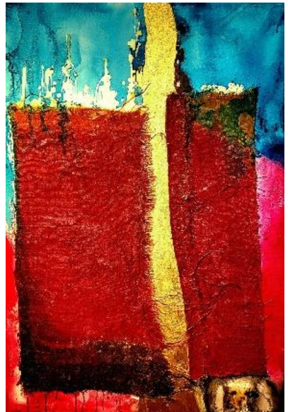
„Der Vorhang des Tempels zerriss von oben bis unten“ Mt 27,51 (Melissa Gentner)

18:30 Uhr Hl. Messe in französischer Sprache International Church (Pastor Orphée Agbahey)